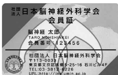
（一社）日本脳神経外科学会会員証

学会参加期間中は、毎日、来場（学会場にきた時）および退場時（学会場から帰る時）に領域講習受付を下記会員証（ICカード）で行ってください。