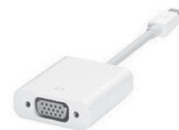
変換アダプター例