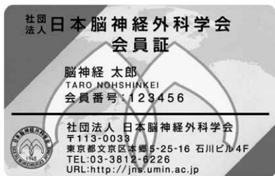
（一社）日本脳神経外科学会会員証

学会参加期間中は、毎日、来場（学会場に来た時）および退場時（学会場から帰る時）に領域講習受付を「下記」会員証（ICカード）で行ってください。