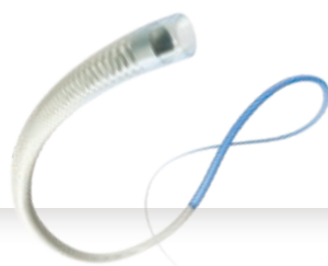
AXS Catalyst® 6 Distal Access Catheter