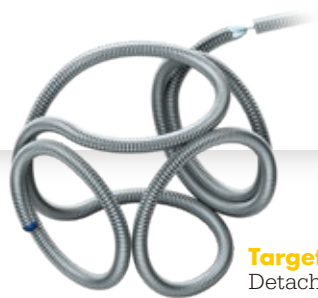
Target® Detachable Coils

TARGET 10 years Leading innovation. Saving lives.