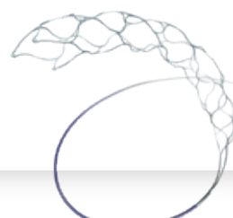
Trevor NXT® ProVue Retriever