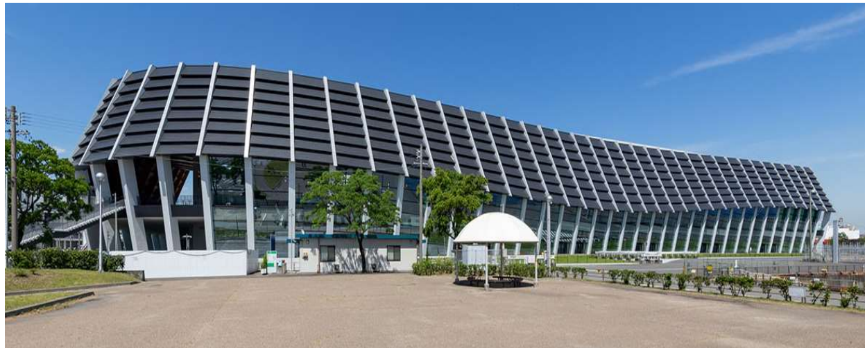
ポートメッセなごや 第一展示館 写真