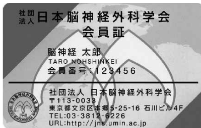
（一社）日本脳神経外科学会会員証

学会参加期間中は、毎日、来場（学会場にきた時）および退場時（学会場から帰る時）に領域講習受付を下記会員証（ICカード）で行ってください。