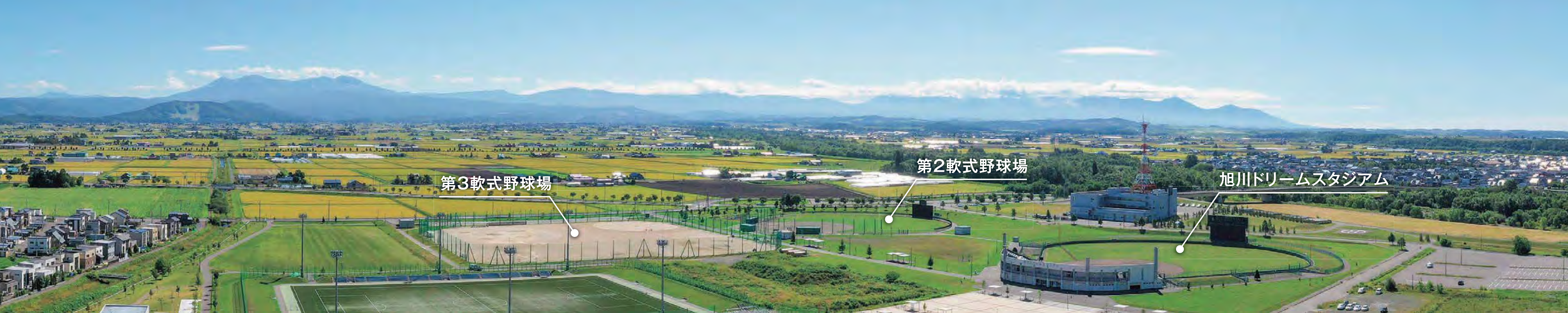
旭川ドリームスタジアム(第1軟式野球場)