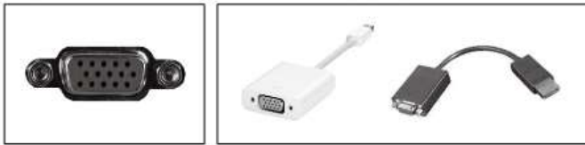
ミニD-sub15ピン 他コネクタからの接続変換ケーブル例